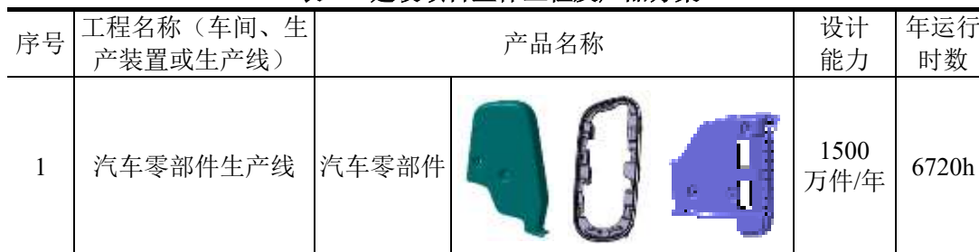
表 2-1 建设项目主体工程及产品方案

注：本项目生产的汽车零部件主要为注塑件，包括汽车方向盘配件、扶手、座椅配件、外观配件等，外形尺寸根据客户要求制定。