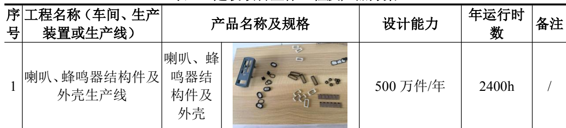
表 2-1 建设项目主体工程及产品方案