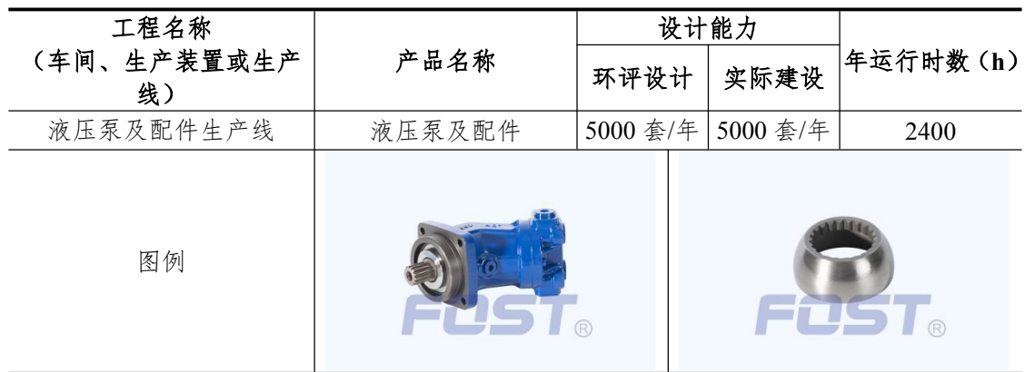
表 1 本项目产品方案表